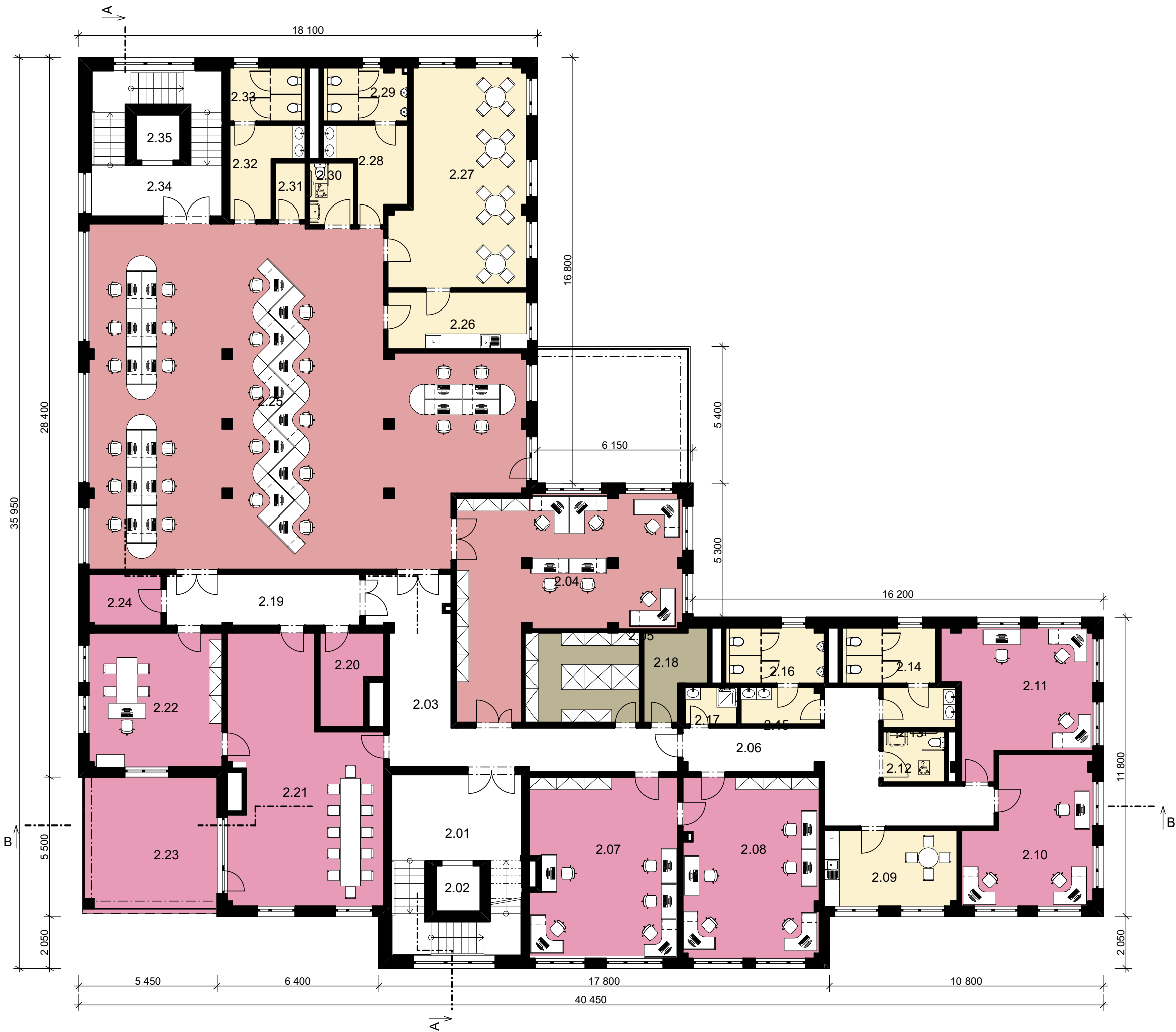
TABULKA MÍSTNOSTÍ 2.NP